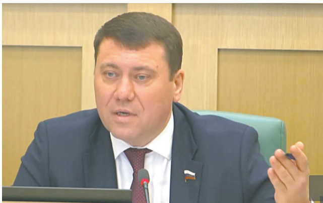
Сенатор от Амурской области Иван Абрамов обратил внимание зампреда Правительства РФ Дмитрия Патрушева на подготовку к пожароопасному периоду.

Возможности контроля возгораний с помощью беспилотных летательных средств, а также анализ спутниковых снимков зондирования земли - являются важнейшими инструментами эффективного развития информационной системы мониторинга лесных пожаров.