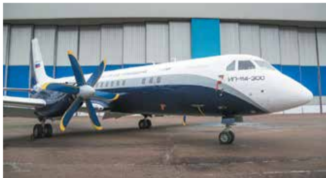
Модернизированный самолет ИЛ-114

На сегодняшний день в Минпромторге РФ разработана программа «Развитие региональной авиации в Российской Федерации», где представлены проекты производства отечественных самолетов для внутрирегиональных перевозок по Дальнему Востоку и Арктике.