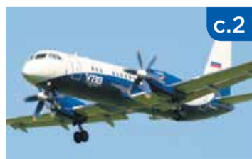
Дальневосточное небо объединит единая авиакомпания