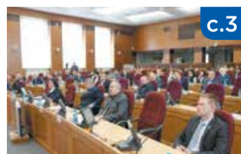
Амурских ветеранов «прокатили» с транспортным налогом