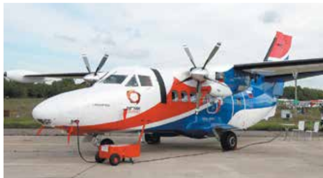
Многоцелевой двухдвигательный самолет Л-410

Начало серийного производства: 2023 год.