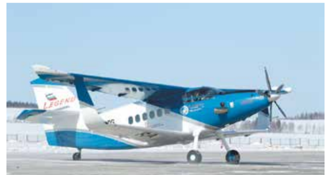
Легкий многоцелевой самолет «Байкал»

Начало серийного производства: 2017 год.