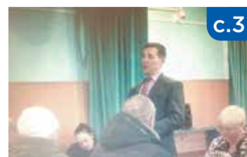
«Мы делили апельсин», или Как можно потратить «чужие» деньги всем